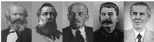
Karl Marx, Friedrich Engels, Vladimir Lenin, Joseph Stalin, Enver Hoxha